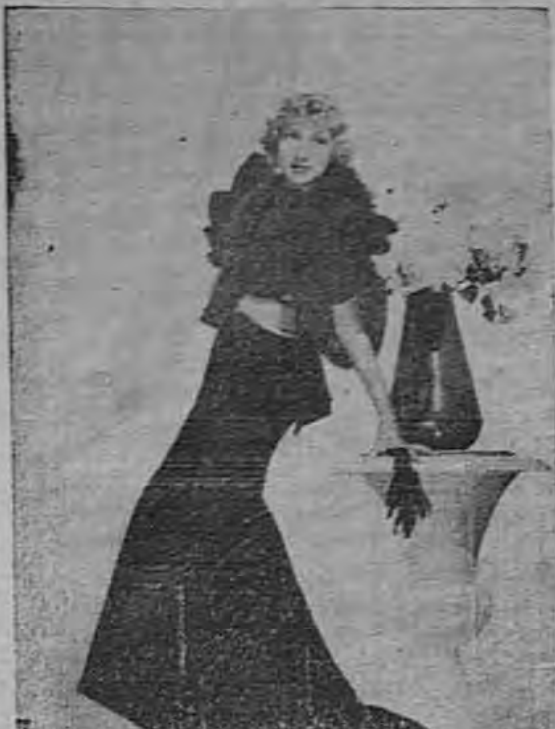
Original modelo de noche que luce Gertrude Michael, artista de la Paramount.