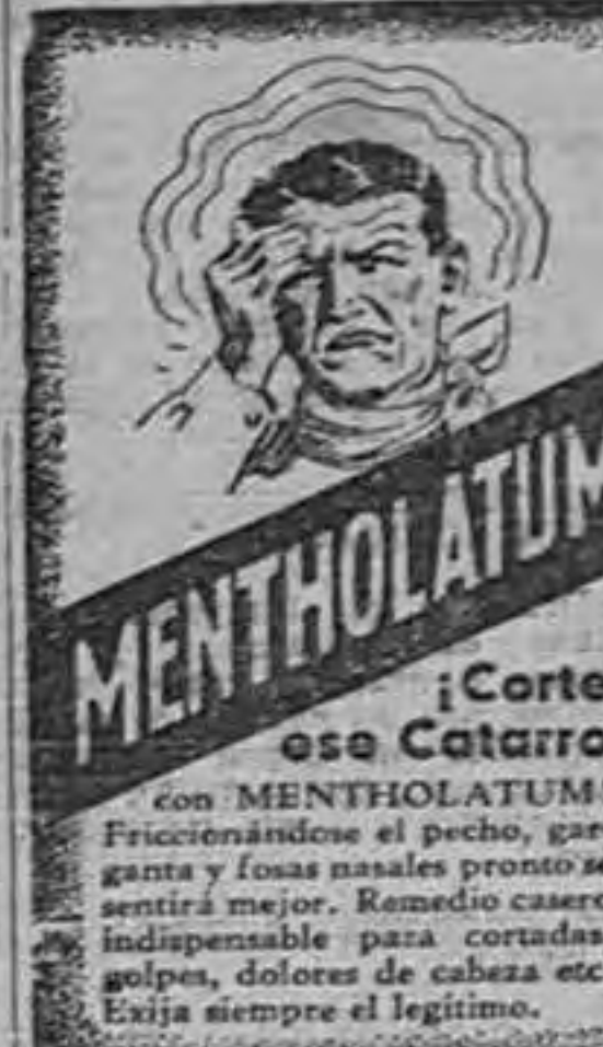
¡Corte ese Catarro con MENTHOLATUM!

La Escuela Socialista aspira a "enriquecer la inteligencia y el entendimiento de los hombres..."